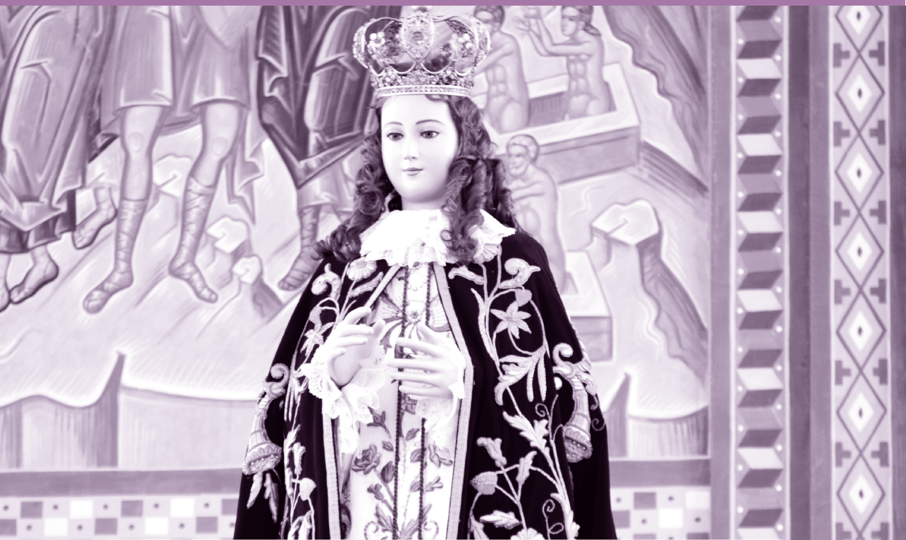
Virgen de las 40 horas de Limache