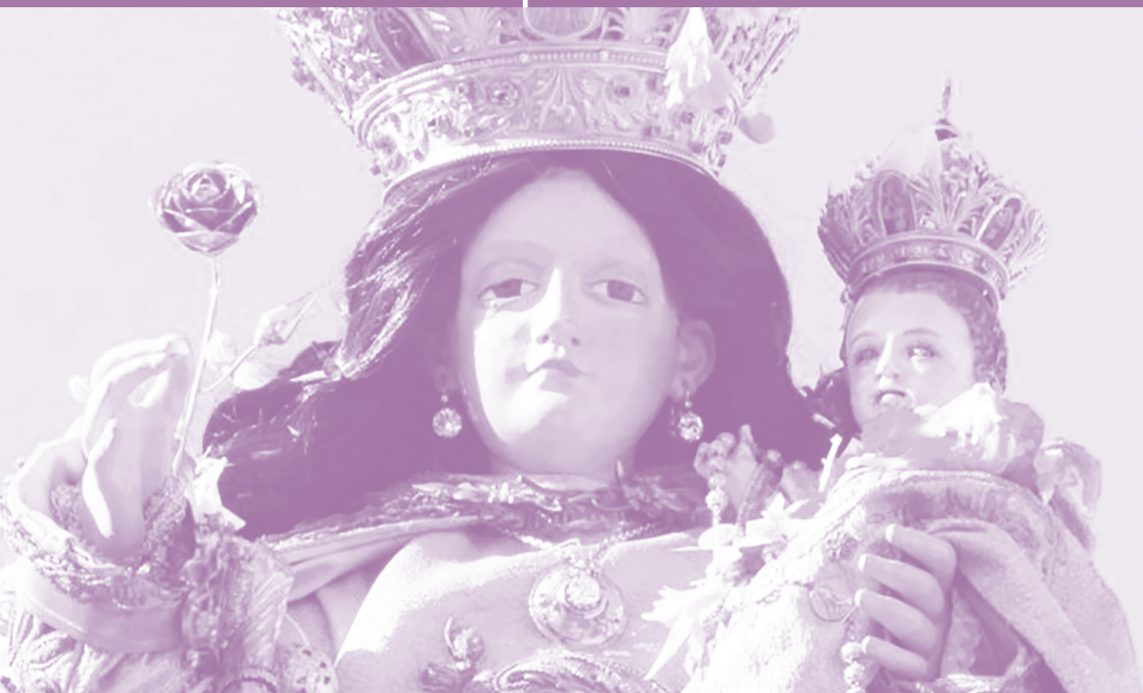
Virgen del Rosario de Andacollo

semana del 13 de noviembre al 19 de noviembre del 2023