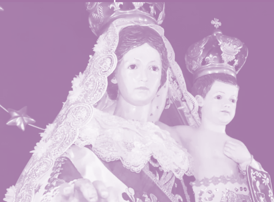
Virgen del Carmen de la Tirana

semana del 04 de diciembre al 07 de diciembre del 2023