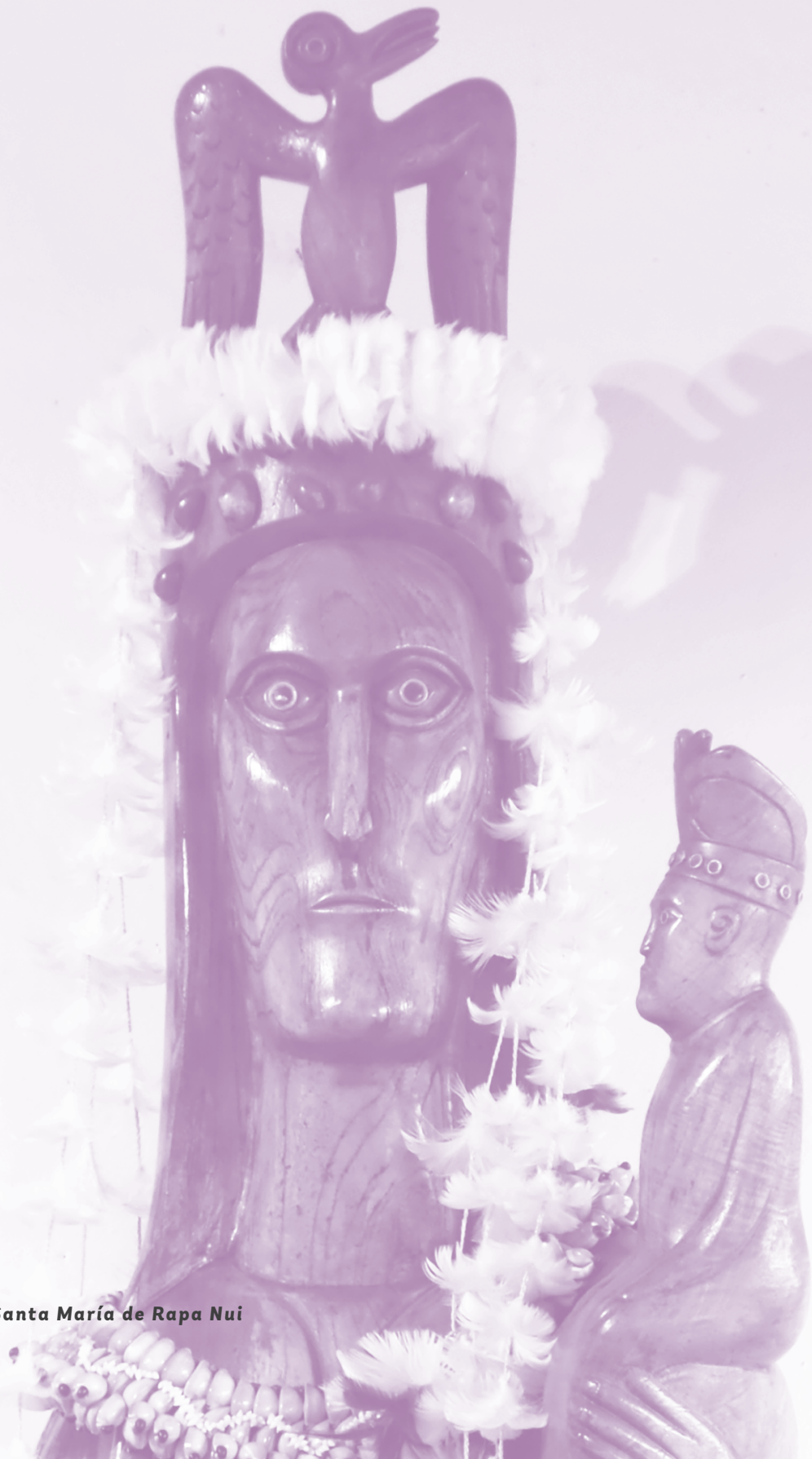
Santa María de Rapa Nui