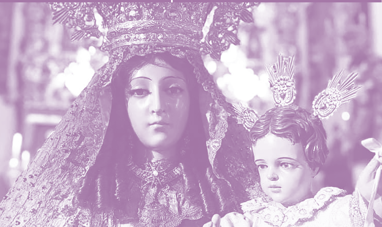
Virgen del Carmen

semana del 8 de noviembre al 12 de noviembre del 2023